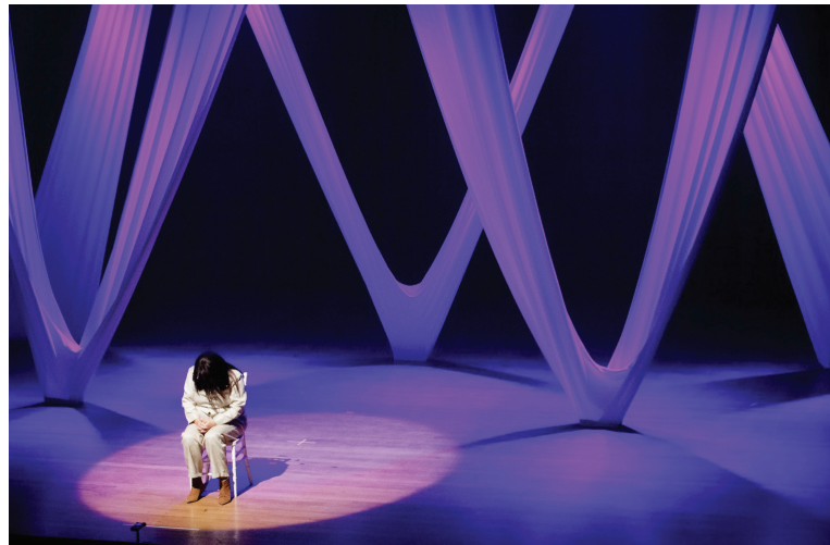
“Além da Vida” terá apresentação única no Teatro Municipal neste sábado (20)