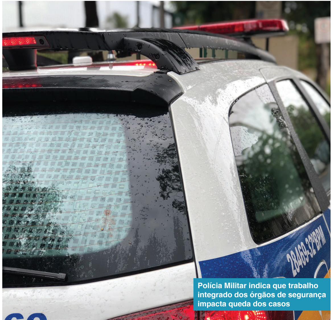
Polícia Militar indica que trabalho integrado dos órgãos de segurança impacta queda dos casos

“Trabalhamos com uma análise criminal para enten-